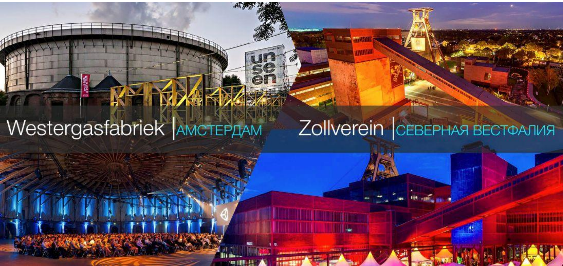
Westergasfabriek | АМСТЕРДАМ